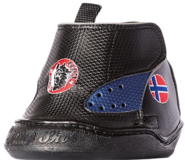
Modell „Ultimate“ (205,00€/Paar)