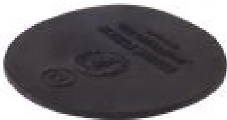
Dämpfungseinlagen von Equine Fusion zu 18,00€/Paar