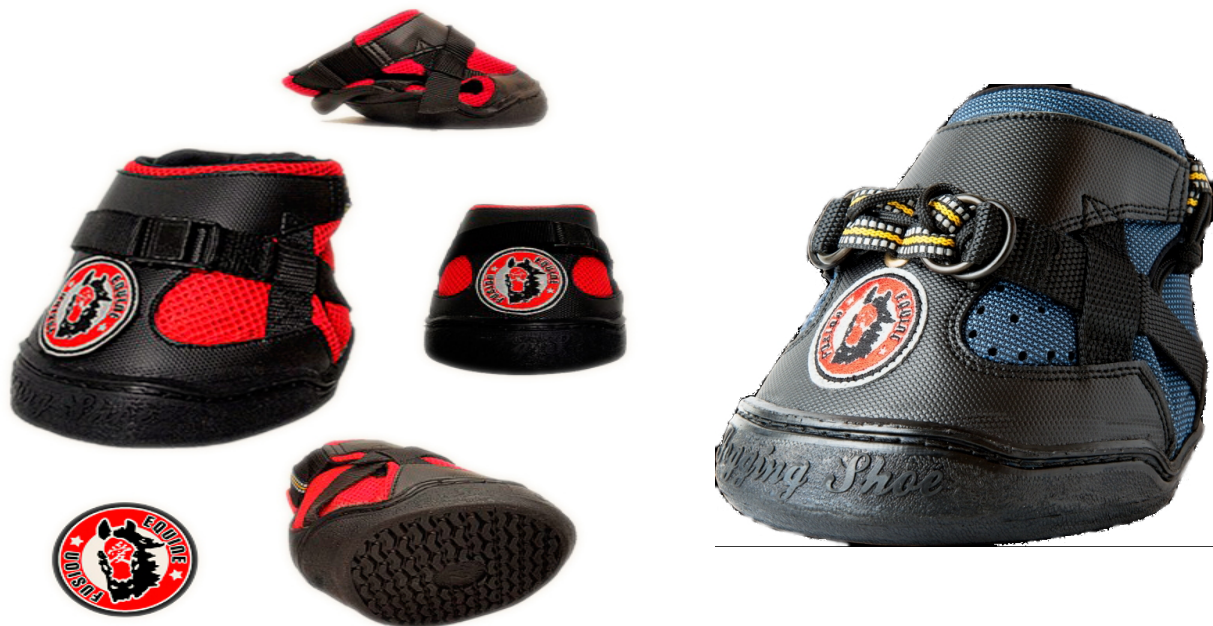
Modell „Ultra“ (185,00€/Paar)

Neben dem aktuellen Modell sind auch die Vorgängermodelle „Ultimate“, „Ultra“ und „Performance“ weiterhin lieferbar. Für alle Jogging-Shoes sind direkt vom Hersteller Dämpfungseinlagen zur noch besseren Wirkung des Schuhs verfügbar.